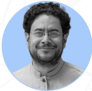
Ivan Cepeda 1.540.391 votos (65,13%)

Más allá de si tiene o no personería jurídica el Pacto Histórico, el gran triunfo del Presidente Petro es haber podido consolidar a toda la izquierda en un solo movimiento, capaz de movilizarse como una fuerza electoral potente, en una 'fecha fría'.